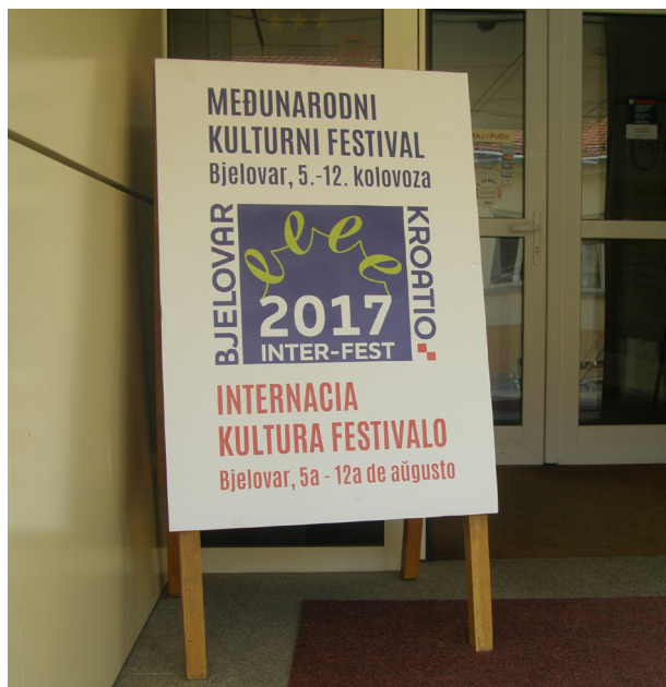
Granda afiŝo ĉe la enirejo de la Hotelo Central, kiu sciigis, ke ĉi tie okazas INTER-FEST